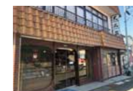
おおいしや 大崎市田尻沼部字新富岡25-4 TEL 0229-39-0348 営：8:30～18:30（日曜、祝日は18:00まで） 休：火曜日（祝日の場合は営業）、1月1日