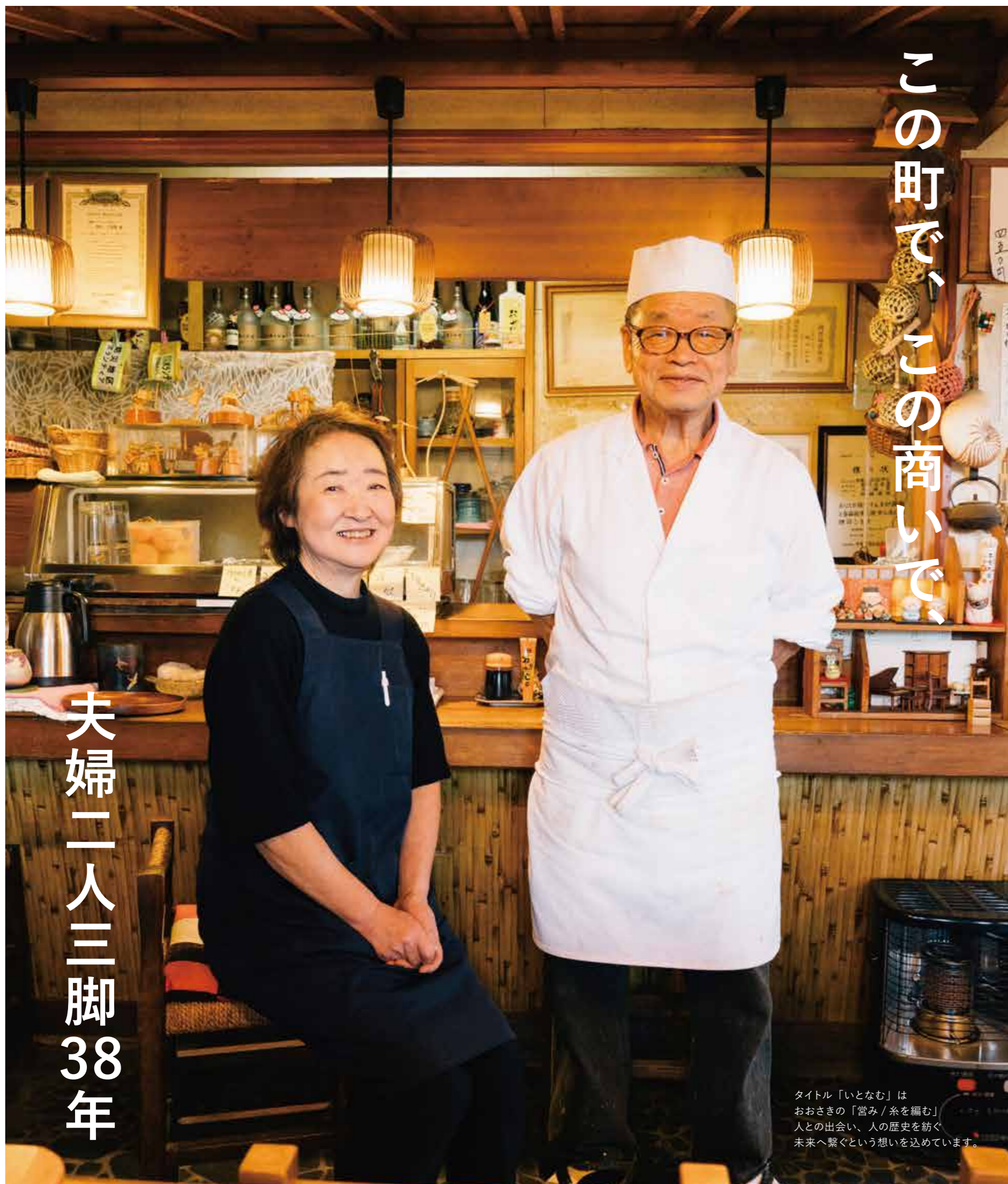
タイトル「いとなむ」は おおさきの「営み/糸を編む」 人との出会い、人の歴史を紡ぐ 未来へ繋ぐという想いを込めています。